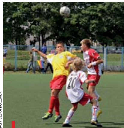
W piłkarskich rozgrywkach udział wzięli chłopcy z rocznika 1998 i młodsi