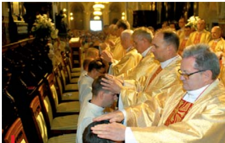
Przez włożenie rąk i modlitwę neoprezbiterów błogosławili starsi kapłani

Jest to wymowna katecheza o Kościele, kapłaństwie i powołaniu,