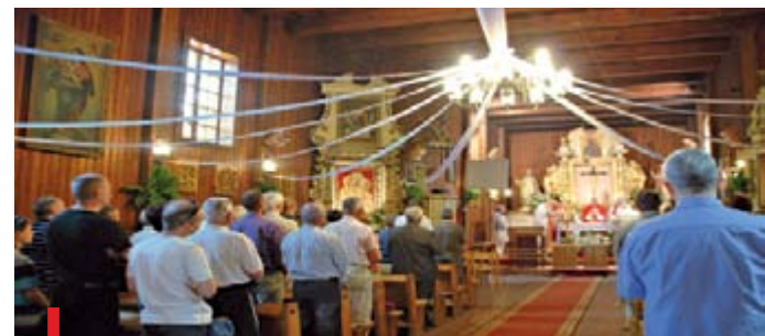
Na „spotkanie z Talbotem” przyjechały osoby związane z AA, m.in. z Warszawy, Ciechanowa i okolic