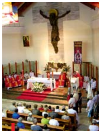
Modlitwa za ojczyznę i dziękczynienie za bł. Jerzego Popiełuskę