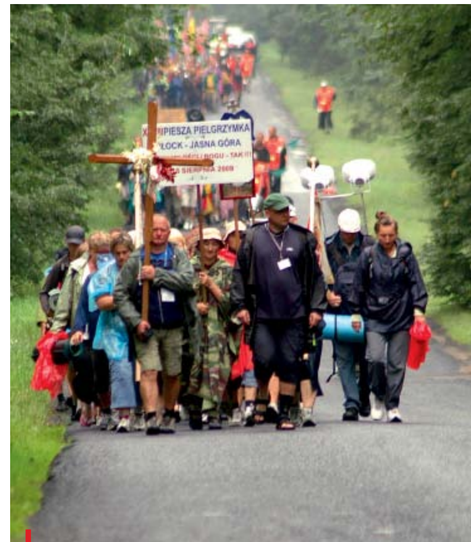
Prawda domaga się szczerzego spojrzenia na siebie i na swoje życie

Wakacyjne wyjazdy rekolekcyjne organizują w diecezji płockiej również Ruch Rodzin Nazaretańskich i Ruch Domowego Kościoła. •