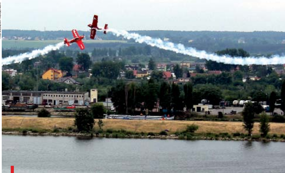
PŁOCK. W ostatnich latach ekstremalne pokazy lotnicze już kilka razy zakończyły się tragicznie

Po raz piąty niebezpieczne akrobacje lotnicze ściągnęły do Płocka tysiące fanów tego ekstremalnego sportu. Widownia przybyła z całej Polski 18 czerwca oglądała z wysokości na 50 metrów płockiego wzgórza pokazy lotnicze nad Wisłą. Kilka tysięcy widzów wstrzymało oddech, gdy pilotowany przez Marka Szufę samolot uderzył o taflę wody i rozpadł się doszczętnie. Utytułowany i doświadczony pilot zmarł w płockim szpitalu. Z chwilą tragicznego wypadku widowiskowa impreza została zakończona. Wśród świadków tragicznego zdarzenia usłyszeć można było i takie komentarze: Czy ten nieszczęśliwy wypadek coś zmieni? A może za kilka dni, emocje ucihną i... znów spotkamy się na kolejnych ekstremalnych akrobacjach lotniczych. Tak jak w starożytności, tak i dziś ludzie przecież Kochają i grzyska.